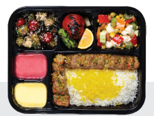
چلو چابلی کباب مخلوط گوشت کوسفندی و گوساله ۱۵۰ گرم / چلو ۲۰۰ گرم برنج ایرانی