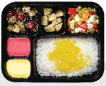
چلو خورشت قورمه سبزی (روزهای فرد) گوشت ران گوساله ۶۰ گرم / چلو ۲۵۰ گرم برنج ایرانی