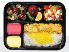
چلو جوجه کباب ران بی استخوان / سینه ران بی استخوان ۱۵۰ گرم / چلو ۲۰۰ گرم برنج ایرانی