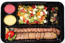
خوراک کباب سلطانی راسته کوسفندی ۲۰۰ گرم / کوبیده ۱۵۰ گرم / با سبزیجات ویژه