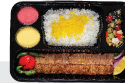
چلو کباب سلطانی راسته کوسفندی ۲۰۰ گرم / کوبیده ۱۵۰ گرم / چلو ۳۵۰ گرم برنج ایرانی