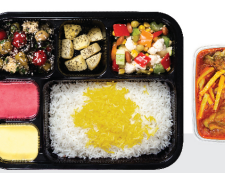
شیرین پلو (۳۵۰ گرم) | زرشک پلو (۳۵۰ گرم) | چلو کره (۳۵۰ گرم) | باقالی پلو (۳۵۰ گرم) پخت با برنج ایرانی | پخت با برنج ایرانی | پخت با برنج ایرانی | پخت با برنج ایرانی