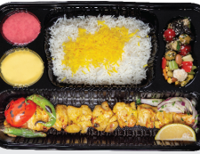
چلو جوجه کباب ران بی استخوان / سینه ران بی استخوان ۳۰۰ گرم / چلو ۳۵۰ گرم برنج ایرانی