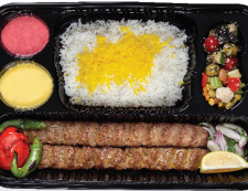
چلو کباب کوبیده جمعا ۳۰۰ گرم / چلو ۳۵۰ گرم برنج ایرانی