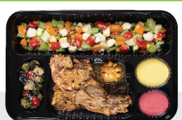
خوراک روایت ماهی ماهی سالمون ۳۰۰ گرم / با سبزیجات ویژه