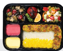
کوبیده مرغ آجیلی ۱۳۰ گرم سینه و ران مرغ / ۵۰ گرم خلال پسته / چلو ۲۰۰ گرم برنج ایرانی