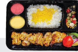
چلو جوجه کباب با استخوان ران مرغ ۴۶۰ گرم / چلو ۳۵۰ گرم برنج ایرانی