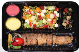
خوراک کباب برگ راسته کوسفندی ۲۰۰ گرم / با سبزیجات ویژه