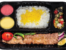
چلو کباب برگ راسته کوسفندی ۲۰۰ گرم / چلو ۳۵۰ گرم برنج ایرانی