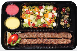
خوراک کباب کوبیده ۲ سیخ کوبیده جمعا ۳۰۰ گرم / با سبزیجات ویژه