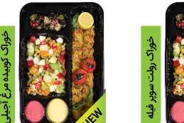
خوراک کوبیده مرغ اصیلی ۱۳۰ گرم سینه و ران مرغ / ۵۰ گرم خلال پسته / با سبزیجات ویژه