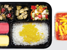
چلو خورشت قیمه سیب زمینی (روزهای زوج) گوشت ران گوساله ۶۰ گرم / چلو ۲۵۰ گرم برنج ایرانی