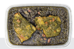
چلو روایت سبزی فیه ۲۵۰ گرم فله مرغ / ۸۰ گرم کوبیده / چلو ۳۵۰ گرم برنج ایرانی