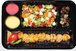
خوراک جوجه کباب ران بی استخوان / سینه ران بی استخوان ۳۰۰ گرم / با سبزیجات ویژه