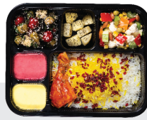
زرشک پلو با مرغ ساق ران ۱۳۰ گرم / چلو ۲۰۰ گرم برنج ایرانی

همان چیزی که در عکس میبینید را نوش جان خواهید کرد 😊 ما اصالت سفره ایرانی مدرن کردیم