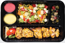
خوراک جوجه کباب با استخوان ران مرغ ۴۶۰ گرم / با سبزیجات ویژه