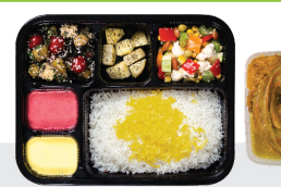
زرشک پلو با مرغ ران مرغ ۳۵۰ گرم / چلو ۳۵۰ گرم برنج ایرانی