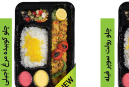
خوراک کوبیده مرغ اصیلی ۱۳۰ گرم سینه و ران مرغ / ۵۰ گرم خلال پسته / چلو ۳۵۰ گرم برنج ایرانی