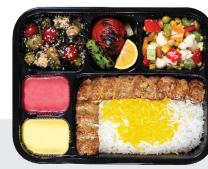
چلو کباب کوبیده ۱ سیخ کوبیده جمعا ۱۵۰ گرم / چلو ۲۰۰ گرم برنج ایرانی