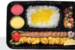
چلو کباب کوبیده ران بی استخوان ۳۰۰ گرم / یک سیخ کوبیده ۱۵۰ گرم / چلو ۳۵۰ گرم برنج ایرانی