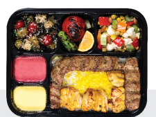
چلو کباب وزیری ران بی استخوان ۱۵۰ گرم / یک سیخ کوبیده ۱۵۰ گرم / چلو ۲۰۰ گرم برنج ایرانی