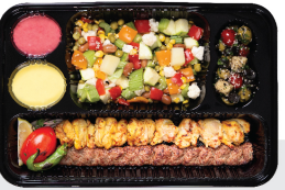
خوراک کباب کوبیده ران بی استخوان ۳۰۰ گرم / یک سیخ کوبیده ۱۵۰ گرم / با سبزیجات ویژه