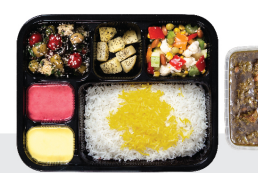
چلو خورشت قیمه سیب زمینی گوشت گردن کوسفندی ۲۵۰ گرم / چلو ۳۵۰ گرم برنج ایرانی