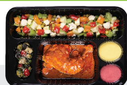
چلو کوبیده مرغ اصیلی ۱۳۰ گرم سینه و ران مرغ / ۵۰ گرم خلال پسته / چلو ۳۵۰ گرم برنج ایرانی